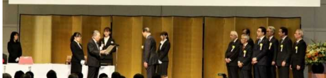
昨年度の表彰式（2020年1月29日：東京ビッグサイト）