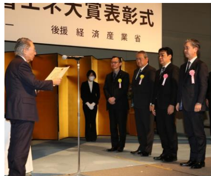
2022年度の表彰式：2023年2月1日：東京ビッグサイトにおいて実施いたしました。