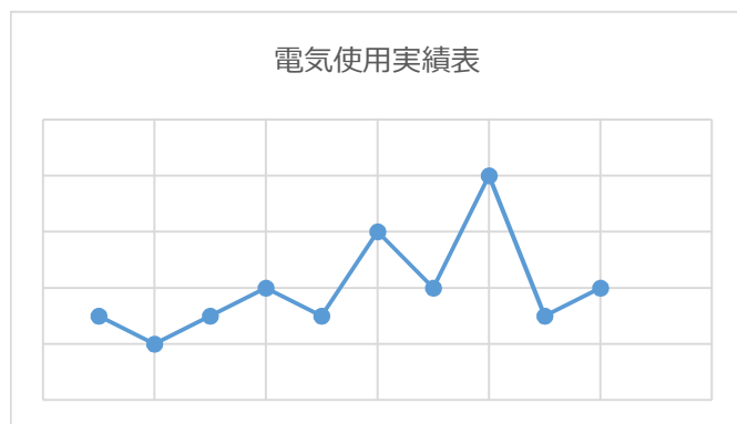
図 2. 電気使用実績表

更に「〇〇〇（製品名）」のプラットフォームにログインすることで「 電気使用実績表（図2参照） 」より時間帯別・曜日別の実績表の他、30分毎デマンドランキング表（上位10件）・今後のデマンド予測値等の顧客ニーズに合った詳細な情報 ※4 をチェックすることができる。